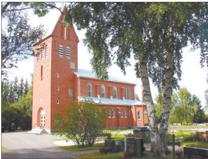
Pirkkalan vanha punatiilinen kirkko on erinomaisen hääkirkko, jonne mahtuu noin parisataa häävierasta. Kirkko sijaitsee keskellä kaunista maalaismaisemaa Anian rantatienellä.

tään nähtävyydessä ja seurallisuudessa, mutta toisaalta voitetaan intiimiydessä, joka vie ihmiselämän peruskysymysten