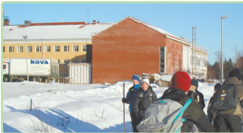
Nuolialan koululaajennus on valmistumassa. Seuraavaksi rakennetaan lisää koulutilaa Naistenmatkan koululle.

Taloudelliset tekijät eivät aja Pirkkala Tampereen tai kenenkään muunkaan syliin. Tampereen pormestarillinen tilaaja-tuottaja syli odottaa kunnastamme, mikäli emme halua jatkaa itsenäisenä tai valtiovalnan tahoilta muuta päätetään. Pirkkala katsoo vahvasti eteenpäin tulevaisuuteen uskon. Mielestäni keskeisin merkki tästä on kunnan investointitahhti. Tiedämmehän omasta henkilökohtaisesta taloudestammekin, että mikäli tulevat näkyvät